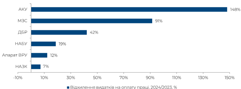
Рисунок 4. Зміна видатків на оплату праці в органах державної влади, які не проводять класифікацію посад у 2024 році, а застосовують умови, встановлені на 2023 рік

Також на рис. 4 наведемо зміну видатків на оплату праці в органах державної влади, які, відповідно до Закону України «Про Державний бюджет України на 2024 рік», не зобов'язані проводити класифікацію посад, а застосовують умови оплати праці, встановлені на 2023 рік.