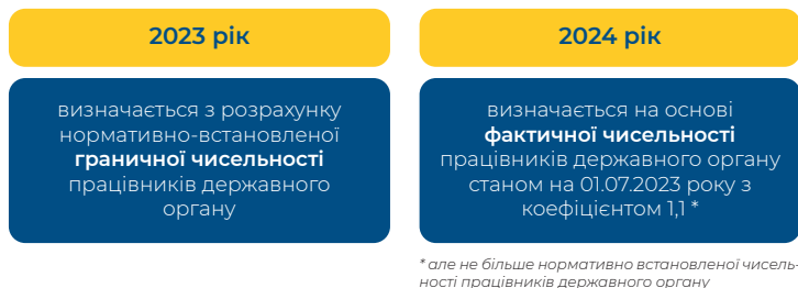
Рисунок 1. Зміни підходу до визначення Фонду оплати праці державного органу

Що стосується фонду оплати праці державного органу, то тут теж відбулись певні зміни у його визначенні (рис. 1).